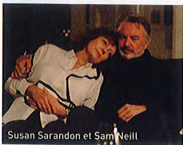
Susan Sarandon et Sam Neill