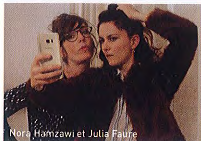
Nora Hamzawi et Julia Faure